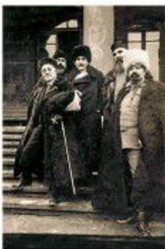
Ալեքսանդր Շիրվանզադեն, Խորեն Բախտրյան Մուրադբեկյանը, Հովհաննես Թումանյանը, Կիկոզյանոս քահանա Տեր-Քավոյանը, Հովսեփ Խունուկը, 1914