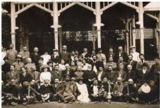
Սայաթ–Նուվայի մահարձանի բացման արարողության ժամանակ Թիֆլիսի Սուրբ Գևորգ եկեղեցու բակում, 1914, մայիս