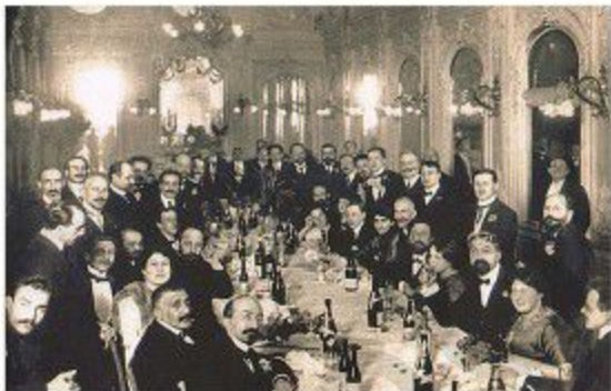
Հովհաննես Թումանյանի արդարացման առիթով իայ համայնքի կողմից կազմակերպված խնջույքը Պետերբուրգի «Հոնոն» ռեստորանում, աջից կենտրոնը (նստած)՝ Հովհաննես Թումանյանն է, յոթերորդը՝ դուստր Աշխենը, 1912